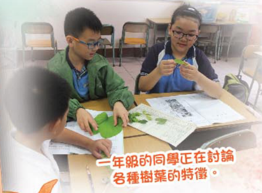
一年級同學正在討論 各種樹葉的特徵。