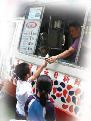
同學們急不及待地想從叔叔手上接過雪糕。