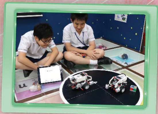
於比賽前進行訓練，互相切磋， 能夠把對方推出圈外為勝。