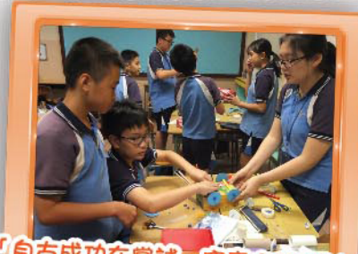
「自古成功在嘗試」究竟哪種材料 最適合製作模型車？ 五年級的同學們，齊來測試吧！