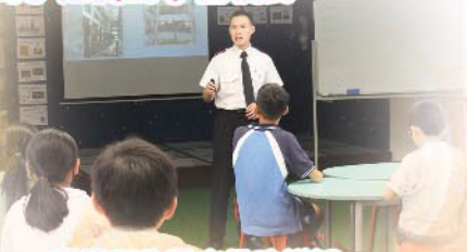
飛機師生動有趣的講解，讓同學對飛機有多一份的喜愛。

一個有系統的航空課程，讓本校學生探索到奇妙的航空世界，建立個人自信、培育責任感並發揮潛能。此外，在資深機師的親身指導下，亦啟發他們對飛行的興趣。「二十小時課堂」及「兩天日營」過後，表現優異的三位同學，最終代表本校前往新加坡參加飛行國際比賽，大大擴闊了他們的學習視野。