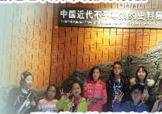
五年級同學們到南京遊學，認識當地的文化及歷史。