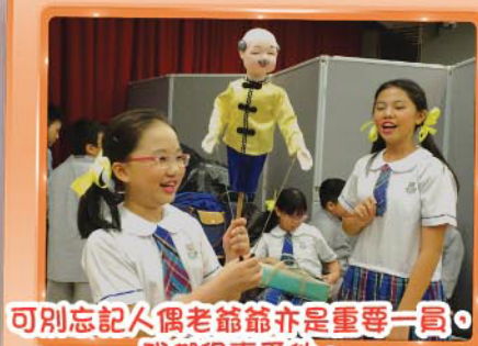
可別忘記人偶老爺爺亦是重要一員，我們很喜愛他。