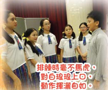
排練時毫不馬虎，對白琅琅上口，動作揮灑自如。