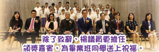
除了致辭，楊議員更擔任頒獎嘉賓，為畢業班同學送上祝福。