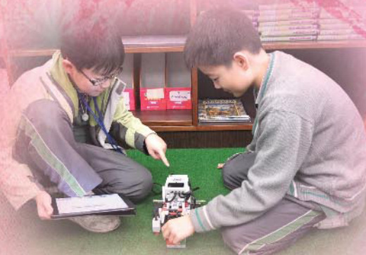
二人合作以平板電腦操控機械人。