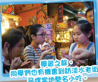
學習之餘，同學們也有機會到訪淡水老街，品嚐當地馳名小吃。