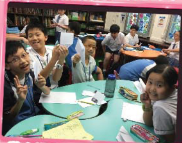
航空課程是理論與實踐並重，自己駕駛的飛機，都是由自己一手一腳搵出來的。