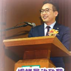
楊議員的致辭發人深省。同時不忘展示他風趣幽默的一面。

在剛過去的六月，本校與牧愛幼稚園舉辦了聯校畢業典禮。當天，本校邀請了楊岳橋議員出席典禮。楊岳橋議員是牧愛小學的校友，現為立法會議員及執業大律師。他在致辭時感謝學校對他的栽培，令他學會了「仁愛、勇敢」的精神。他勸勉畢業班學生好好學習，尋找自己的路向，將來才能為社會出一分力。