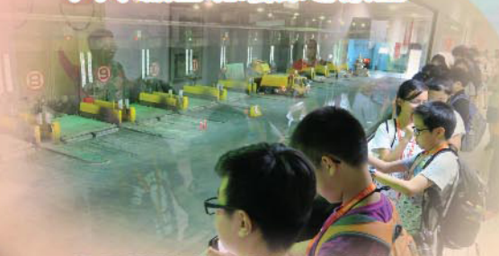
為了認識當地的垃圾處理程序，當然要到台北垃圾焚化廠一遊。