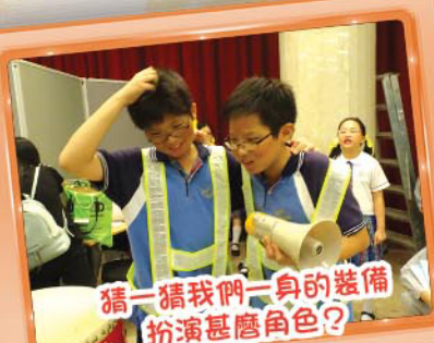
猜一猜我們一身的裝備，扮演甚麼角色？

本校重視發掘學生多方面的潛能，特讓四至五年級的同學參加「新域劇團」。他們能從中建立默契，互相支持和鼓勵。在學年結束時，學生於荃灣大會堂體驗一次較具規模的表演，在觀眾面前從容自如、充滿信心地將成果展現。