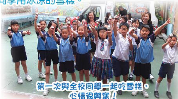
第一次與全校同學一起吃雪糕，心情很興奮！