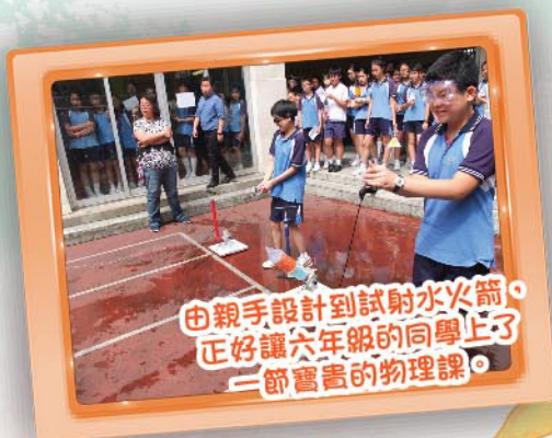
由親手設計到試射水火箭， 正好讓六年級的同學上了 一節實實的物理課。