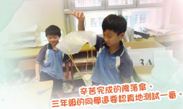
辛苦完成的降落傘， 三年級同學還要認真地測試一番。

為促進學生的高階思考及分析能力，培養對科學探究的興趣，因此學校每年均舉辦「科學探究日」。老師為各年級學生設計了不同主題的學習內容，從而提升學生對科學的學習興趣及探究能力，使學生能體驗科學的奧秘。