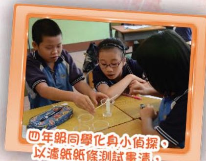
四年級同學化身小偵探， 以濾紙紙條測試蠶清， 看他們多專注呢！