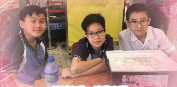
材料齊備，準備出戰 「WRO香港機械人挑戰賽 - 相撲比賽」。