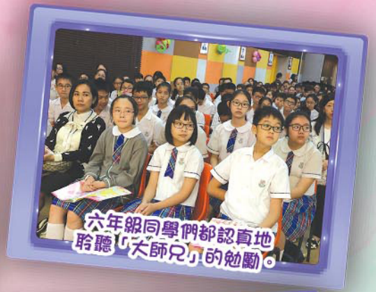
六年級同學們都認真地聆聽「大師兄」的勉勵。