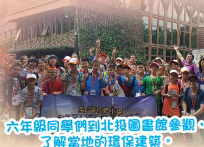
六年級同學們到北投圖書館參觀，了解當地的環保建築。