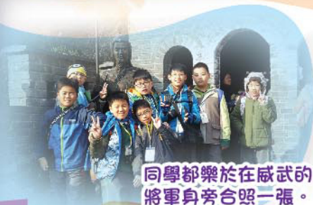
同學都樂於在威武的將軍身旁合照一張。