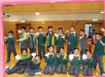
「兩天日營」的特訓，讓一班小機師比試飛機的性能之餘，亦是一場發射技巧上的競賽。