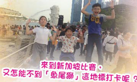
來到新加坡比賽，又怎能不到「魚尾獅」這地標打卡呢？