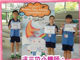
這三位小機師，經過一輪過關斬將的遴選後，終於獲發新加坡飛行國際比賽參賽証。