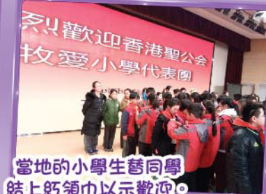
當地的小學生替同學結上紅領巾以示歡迎。