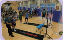
牧愛同學準備就緒，目標是正中紅心。