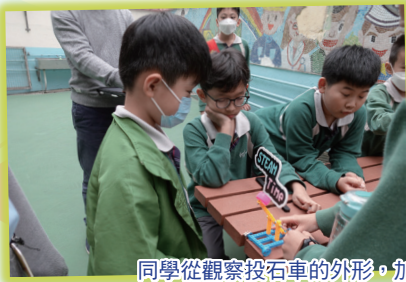
同學從觀察投石車的外形，加深對槓桿原理的認識。