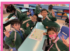
腦明手快，顧名思義就是要「快」，盡快在數字棋盤上計算出乘法的答案。