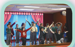
The success of the performance is the result of the hard work of the students.