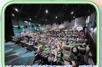
於考試後安排電影活動，讓學生一方面可舒緩考試的緊張心情，另一方面更可從電影中明白堅毅處事、勇於嘗試的重要。