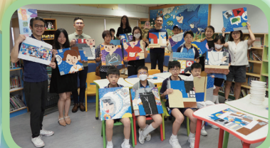
經過幾小時的努力，天氣好轉了，LEGO壁畫亦大致完成！