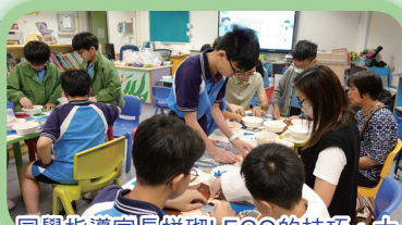
同學指導家長拼砌LEGO的技巧，大家都投入其中。