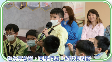
在分享會前，同學們還上網找資料認識尹導演，主動提出問題，讓尹導演和蘇媽媽感到驚訝。