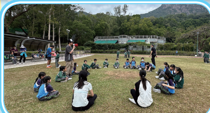
師生在大草地上玩得盡興。