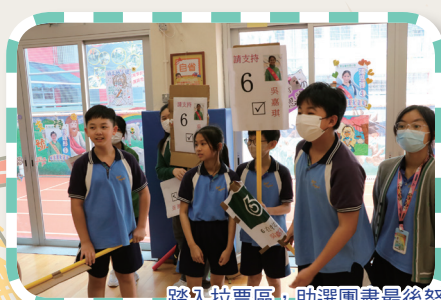
踏入拉票區，助選團盡最後努力為候選人爭取選民寶貴的一票。