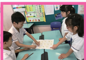
「記憶神童」這遊戲，增強了同學的數字感及記憶力。

透過實踐和遊戲，讓學生運用已有知識解決數學難題，提升學生對數學的興趣。活動加入正向教育元素，培養學生的正向情緒、全情投入、正向關係、意義及成就感，讓學生潛移默化建立正向心理質素。