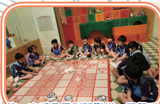
第一次看見巨型鬥獸棋，同學玩得亦樂乎。