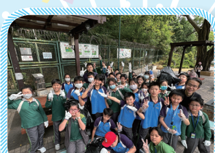
牧愛的好孩子在離開公園前會齊心執拾垃圾，因為我們都是良好的公民啊！