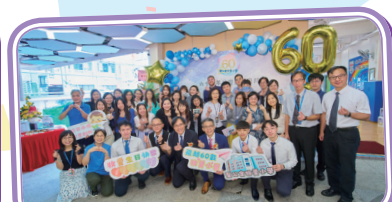
典禮能順利舉行，全賴背後上下一心、勞苦功高的牧愛團隊。