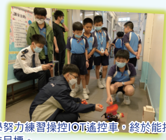
同學努力練習操控IoT遙控車，終於能把乒乓球射進目標。