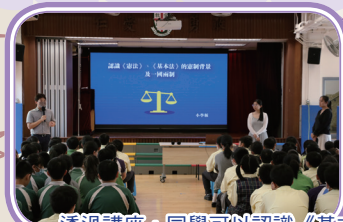
透過講座，同學可以認識《基本法》、《憲法》及一國兩制。

這次國家安全教育講座旨在增強學生的國家認同感和公民意識。針對不同年級，講座內容包括節日慶祝活動、憲法基本法以及香港特殊地位等。通過生動有趣的講解，讓學生加深對國家、制度的了解，培養愛國精神，樹立正確的價值觀。此次活動有助於學生掌握國家安全知識，提升維護國家安全的責任感和使命感。