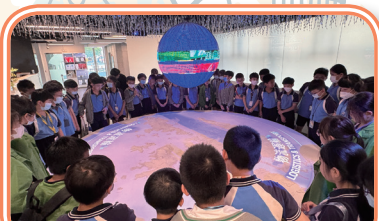
同學圍着展品，探索香港物流運輸的發展。