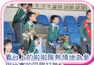
看台上的啦啦隊熱情地為參與比賽的同學打氣。