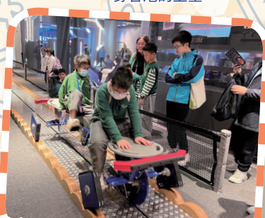
自行車的行駛原理，既涉及力學，又與圖形滾動性有關。