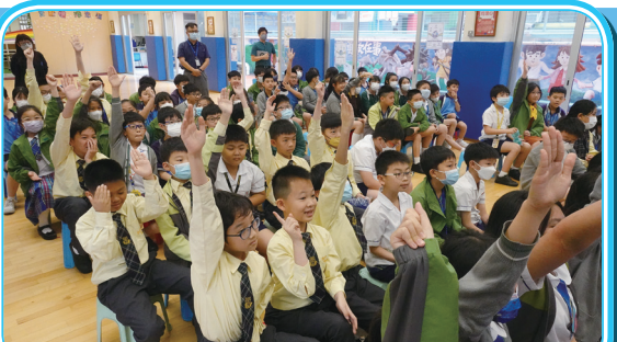
當天全校師生都非常興奮，會場氣氛十分熾熱，當「神奇小子」步入禮堂一刻，全場並報以熱烈的掌聲歡迎。

學生於欣賞電影《媽媽的神奇小子》後，對殘疾運動員的奮鬥故事有初步認識，本校便透過「沒有不可能殘奧運教育計劃」，讓學生進一步認識殘疾運動、殘奧與傷健共融精神。「神奇小子」蘇樺偉先生更親身到校，分享自己成為運動員的心路歷程和在比賽場上勇奪佳績時的感受，並勉勵學生要逆境自強，面對困境時仍要保持積極和樂觀的心態。