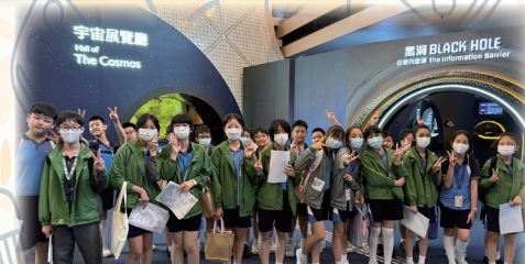
準備進入太空館參觀前，大家的心情已十分興奮。