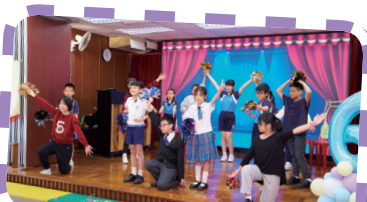
典禮結束後，同學演出英語話劇，來賓都讚不絕口呢！