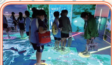
腳踏色彩繽紛的香港地圖，同學恍如置身香港的上空。