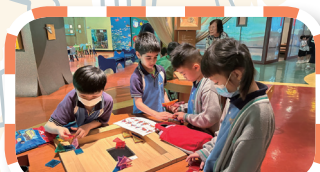
一年級同學從模型拼砌中尋找學習的樂趣。

戶外學習把學習延伸至課室外，學生透過外出參觀，擴闊視野，學習及探索課本以外的知識。多元化的學習方式能加強學生的觀察力，激發他們的好奇心，並提升他們對學習的興趣。