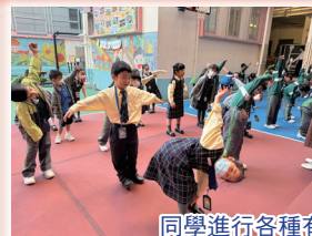
同學進行各種有趣的體育活動。