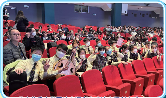
恭喜牧愛中樂團演奏順利完成演奏順利完成!