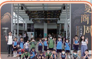
二年級同學要認識中國歷史，從夏商周這三個時代開始就最好不過。