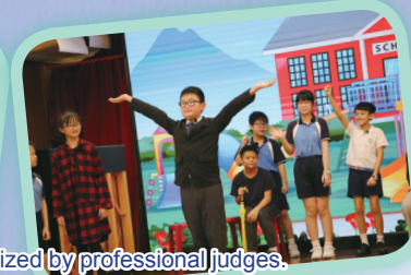
The students' performance was recognized by professional judges.