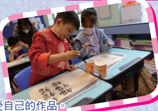
學生樂在中華文化工作坊中，享受之餘，還能享受自己的作品。