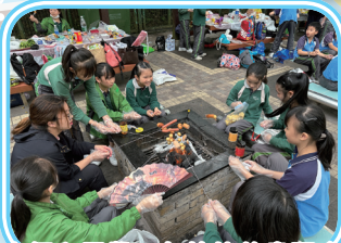
老師和同學一起燒烤的畫面多溫馨！