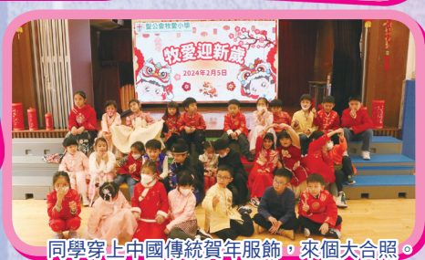
同學穿上中國傳統賀年服飾，來個大合照。