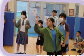
同學的掌聲相信是對參賽學生的最大鼓勵。