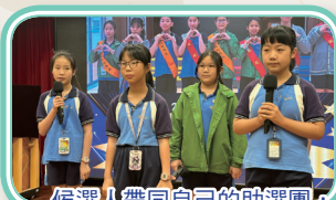
候選人帶同自己的助選團，以不同形式作宣傳。