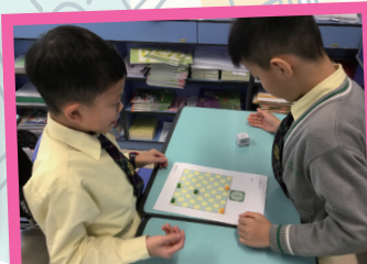
透過與同學一起玩方向棋，學生可以提高方向感。