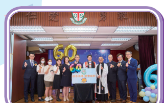
「飛越60載啟動禮」代表一連串的校慶慶祝活動正式展開。