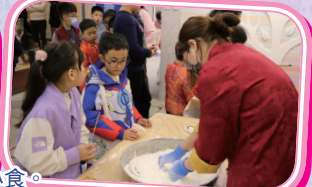
學生在中華文化藝墟中，不但學習到中國文化各式各樣的手工藝，更可以品嚐中國傳統特色小食。