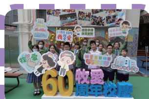
牧愛同學都感受到60周年校慶的歡樂氣氛！