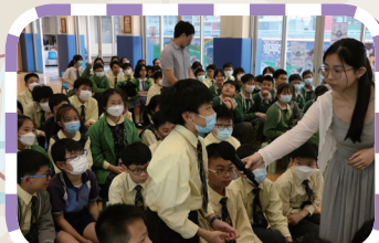
同學對講座的主題很感興趣，踴躍作答。