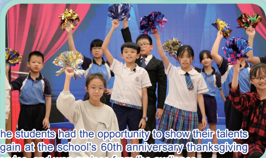
The students had the opportunity to show their talents again at the school's 60th anniversary thanksgiving service, and won praises from the audience.