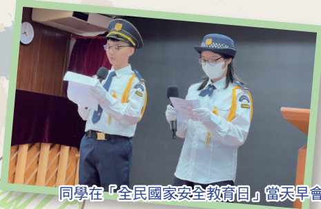
同學在「全民國家安全教育日」當天早會，跟全校學生分享國家的歷史、文化、經濟、科技、政治體制等各方面的國情和發展。

本校透過「全民國家安全教育日」，進行價值觀教育，讓學生認識國家的歷史、文化、經濟、科技、政治體制等各方面的國情和發展，從而懂得關心社會、國家和世界，認同國民身份並珍視中華文化，對社會和國家具責任感和承擔精神。