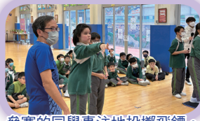
參賽的同學專注地投擲飛鏢。