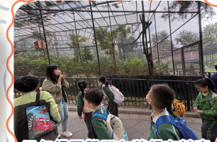
三年級同學正在猜想有甚麼動物居住在籠內。