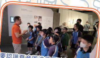
要認識夏商周這三個時代，除了靠觀察文物，還需要一位導賞員。