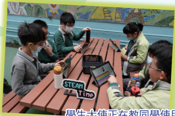
學生大使正在教同學使用他們自製的學習Phonics App。

學生大使在 Steam Time 分享了不同的主題，例如：Steam 套件的科學原理、學生自製的 App、扭計骰機械人、投石車等，讓牧愛學生認識各項 Steam 元素。