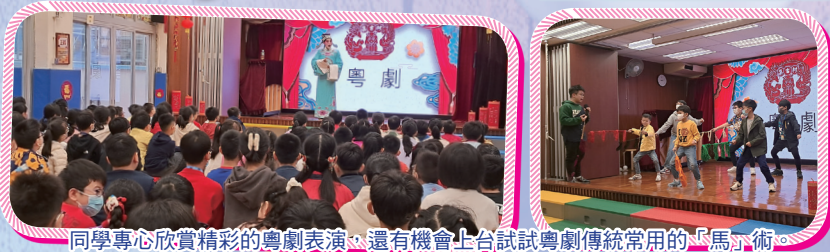
同學專心欣賞精彩的粵劇表演，還有機會上台試試粵劇傳統常用的「馬」術。

本學年舉辦了「牧愛迎新歲」活動，旨在加強學生了解我國的歷史文化，體驗及感受我國文化色彩，並提升國民身份認同感。是次活動內容非常豐富，包括有粵劇表演、中華文化藝墟、中華文化小手工、齊來寫揮春、新春遊戲及中華文化工作坊等，深受學生歡迎。