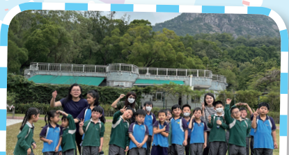
師生一同在獅子山下留影，為這次旅程劃上完美句號。