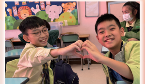
兩位同學的小動作，顯示出無比的大愛心！