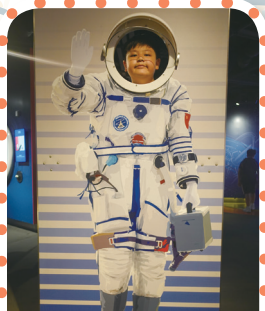
原來很多牧愛同學的夢想都是成為太空人呢！