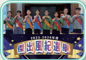
選舉前，候選人齊來一個「展愛心」的合照。

本校一年一度的「傑出風紀選舉」讓學生以不同的身份、角色參與的全校性活動，學生可藉此善用正向品格強項，更可透過主動參選、籌組助選團、構思宣傳策略、進行拉票及全民投票等體驗「正向情緒」、「全情投入」、「正向關係」、「意義」及「成就感」，為全校師生留下深刻而美好的回憶。