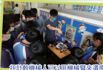
扭計骰機械人可以用機械臂來還原扭計骰，同學都感到驚奇。