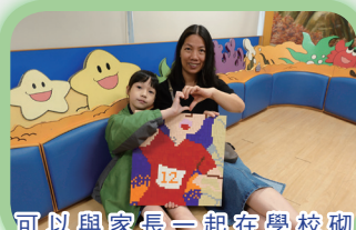
可以與家長一起在學校砌LEGO，相信對同學而言是難忘的體驗。