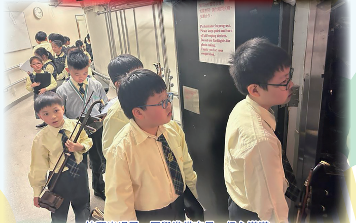
快要出場了，同學準備充足，信心滿滿。