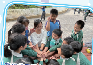
高年級同學也很享受與老師一同玩樂的時光。