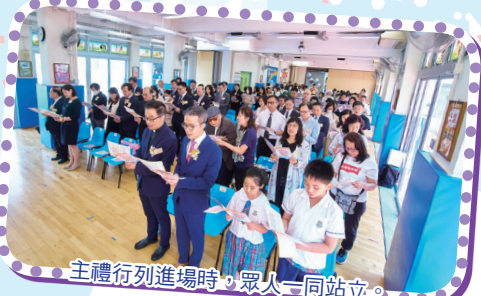
主禮行列進場時，眾人一同站立。