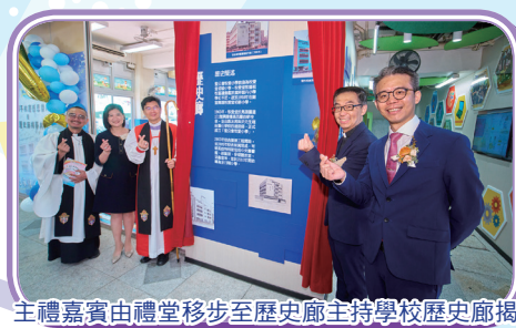
主禮嘉賓由禮堂移步至歷史廊主持學校歷史廊揭幕儀式。