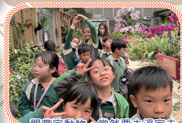
觀賞完動物，當然要去溫室走一趟，與花朵玩遊戲。