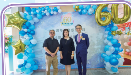
典禮開始前，呂牧師、許校監和梁校長在簽名板前合照。