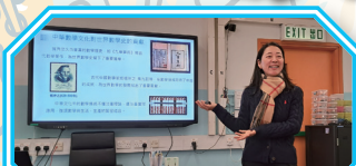
內地專家林老師在數學科教學分享會上，分享如何把中國傳統文化融入教學內容，讓本校老師獲益良多。

由國家教育部及香港教育局合作推行，透過本校數學科教師與內地專家教師一起協作，按本校課程的宗旨和目標，以及學校的發展需要，進行學與教的專業交流。協作的內容包括課程策劃、共同備課、提供專業意見、舉辦專業發展活動、組織跨校分享活動等，以提升教育質素。