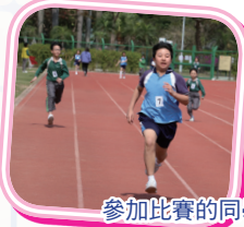
參加比賽的同學都盡力地爭取好成績。