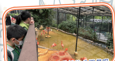
美洲紅鶴是香港動植物公園最吸引遊客觀賞的動物。