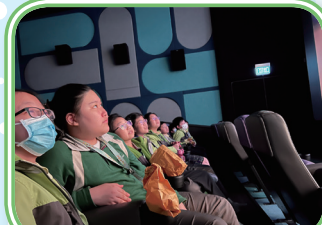
欣賞電影怎可欠缺爆谷呢？梁校長為同學們預備了爆谷，但電影內容太吸引了，同學們都幾乎忘記了手上的美食。