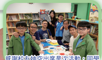
感謝校友抽空出席是次活動，同學都對「大師兄」感到十分好奇呢！