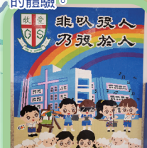
禮堂的LEGO壁畫順利上牆。