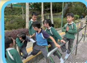
低年級同學創意無限，任何地方都可以成為他們的遊樂場。