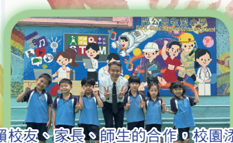
有賴校友、家長、師生的合作，校園添上更多繽紛的色彩。有賴校友、家長、師生的合作，校園添上更多繽紛的色彩。