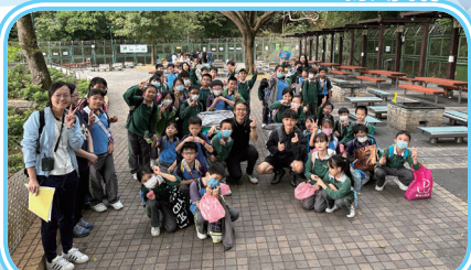
回程前拍下一張大合照，約定來年再一起去旅行吧！

感謝天父一直看顧牧愛小學六十個年頭，今年本校榮幸邀請到郭志丕主教、陳國強座堂主任牧師蒞臨主持校慶感恩崇拜暨學校歷史廊揭幕典禮。嘉賓、校友、師生濟濟一堂，大家從歷史廊的珍貴照片中，回味着昔日童年的回憶。