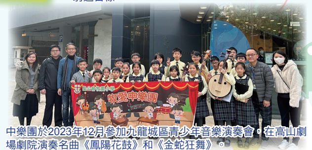
中樂團於2023年12月參加九龍城區青少年音樂演奏會，在高山劇場劇院演奏名曲《鳳陽花鼓》和《金蛇狂舞》。